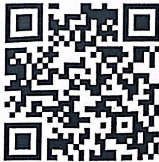
Google Forms สำหรับรายงานผลฯ