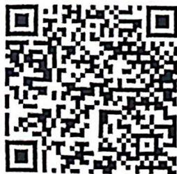
รายละเอียดและ คู่มือการดำเนินงานฯ

๙) กรณีมีปัญหาขัดข้องหรือมีเหตุจำเป็นเร่งด่วน สามารถติดต่อ กลุ่มพัฒนาระบบบริหาร กรมการปกครอง หมายเลขโทรศัพท์ ๐๒ ๒๒๑ ๒๑๘๘