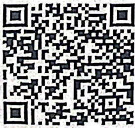
รายละเอียดและ คู่มือการดำเนินงานฯ

๙) กรณีมีปัญหาขัดข้องหรือมีเหตุจำเป็นเร่งด่วน สามารถติดต่อ กลุ่มพัฒนาระบบบริหาร กรมการปกครอง หมายเลขโทรศัพท์ ๐๒ ๒๒๑ ๒๑๘๘