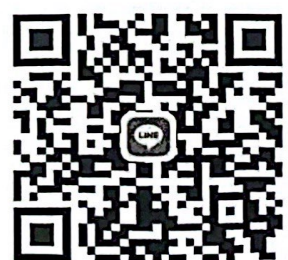
กลุ่มไลน์ประสานงานจังหวัด