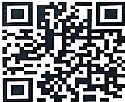
Google Forms สำหรับรายงานผลฯ