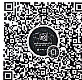
กลุ่มไลน์ประสานงานฯ