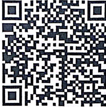
ตัวอย่าง แบบรายงานผลฯ