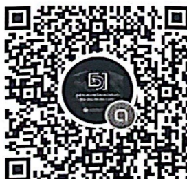
กลุ่มไลน์ประสานงานฯ